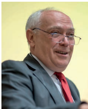
Президент Конгресса SIOP Asia – 2016 академик РАН, д.м.н., профессор

* Перевод резолюции. Оригинал был опубликован в очередном информационном письме SIOP Asia и представлен во Всемирную организацию здравоохранения.