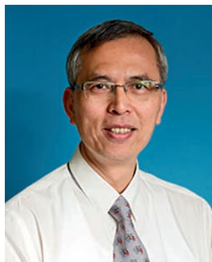
Президент SIOP Asia профессор