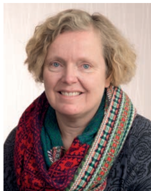
Руководитель глобального отдела защиты интересов сообщества SIOP профессор