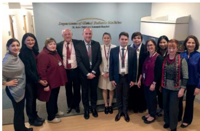
Представители НОДГО в Госпитале Святого Иуды

Рабочая поездка позволила «перезагрузить» отношения с Госпиталем Святого Иуды и найти новые формы совместной работы, реализацию которых мы сможем увидеть в самое ближайшее время.