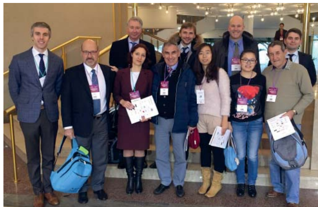
Зарубежными лекторами Конференции стали лидеры сообщества по изучению аутоиммунных заболеваний "Autoimmunity network"