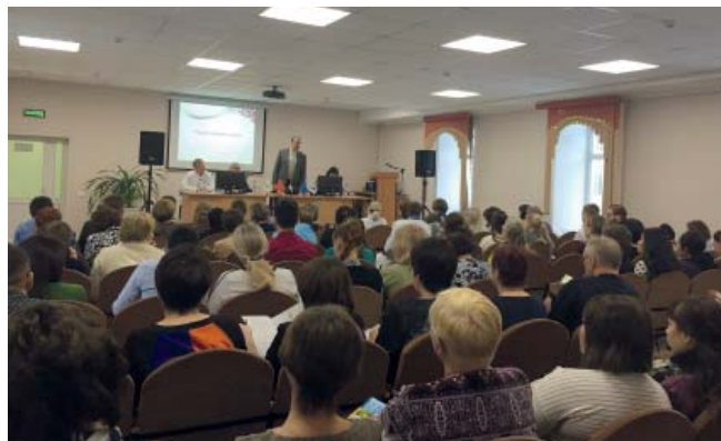
Семинар привлек большое внимание как представителей практического здравоохранения, так и организаторов помощи детям